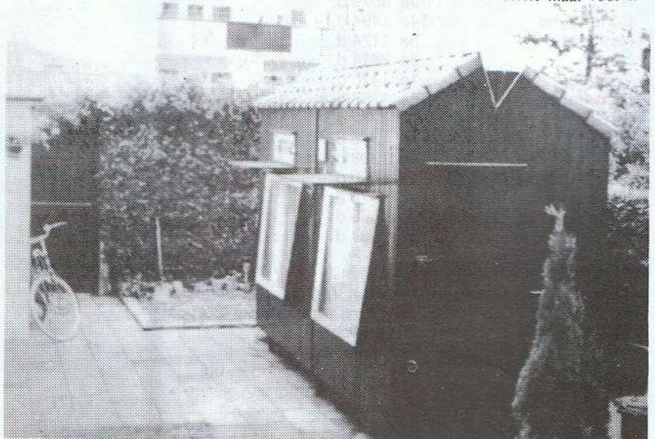
De gehele accommodatie van de 2de Marathonkampioen van Nederland

De laatste weduwman die ik aan u voorstel is de «Barcelona 2», H78-237744. Deze komt ook uit het «Witpennetje», maar nu met de «59» (de volle broer van de «60»). Hij werd ook in 1980 voor de eerste maal voor he